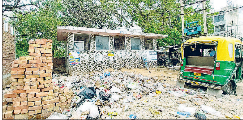
रेवाड़ी। नाईवाली चौक स्थित पब्लिक टॉयलेट के पास गंदगी के ढेर।

टॉयलेट की हालत इतनी बिगड़ चुकी है कि जैसे वर्षों से किसी ने सुध ही न ली हो। लंबे समय से पब्लिक टॉयलेट्स की मरम्मत नहीं हो पा रही है। शहर के ज्यादातर टॉयलेट्स की दीवार जर्जर अवस्था में आ चुकी है। टॉयलेट की दीवारों से प्लास्टर झड़ रहा है। शौचालयों के मेटेनेस को लेकर जनवरी माह में 28.27 लाख रुपये का एक वर्ष के लिए टेंडर किया गया, लेकिन टेंडर होने के बाद से भी अभी तक शौचालयों की हालत में सुधार नहीं हो पाया है। कई सार्वजनिक शौचालयों की सीट, पानी की टंकी, वाशबेशन व दरवाजे तक टूट चुके हैं। नल और फलश भी काम नहीं कर रहे हैं। देखरेख व सफाई नहीं होने पर इन शौचालयों की हालत बिगड़ चुकी है।