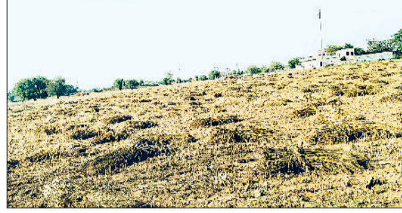
रेवाड़ी। मंगलवार को बरसात का मौसम होने पर अनाजमंडी में ढकी गई सरसों, सोमवार देर रात हुई तेज बरसात से अनाजमंडी के फंड पर जमा पानी तथा एक खेत में काटी गई गेहूँ की फसल।