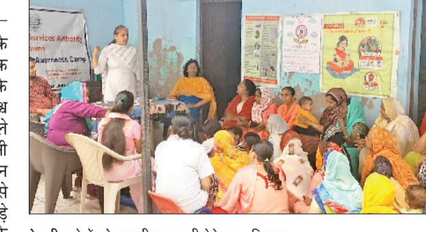
रेवाड़ी। लोगों को कानूनी जानकारी देते हुए अधिवक्ता।