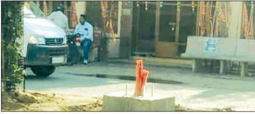
महेन्द्रगढ़। एजेंसी द्वारा डिवाइडर के बीच में बनाए जा रहे फाउंडेशन।

लंबे समय के इंतजार के बाद शहर के बीचों-बीच से गुजर रहे नवनिर्मित फोरलेन स्टेट हाईवे 148वीं के दिन अब बहुरेने वाले हैं। पिछले लगभग एक वर्ष से अंधेरे में डूबा यह मार्ग जल्द ही आधुनिक फैंसी लाइटों से जगमगा उठेगा। अच्छी खबर यह है कि बजट और टेंडर की औपचारिकताओं के बाद अब धरातल पर काम शुरू हो चुका है। एजेंसी द्वारा डिवाइडरों के बीच लाइटों के पोल के लिए फाउंडेशन बनाए जा चुके हैं। बता दें कि गौरतलब है कि पिछले करीब एक वर्ष से इस मुख्य मार्ग पर स्ट्रीट लाइटों का न होना शहरवासियों के लिए बड़ी मुसीबत बना हुआ था। रात के समय अंधेरा होने के कारण न केवल हादसों में बढ़ोतरी हो रही थी, बल्कि आवागमन के कारण वाहन चालकों को जान पर भी बन आती थी। शुरुआत में नगर पालिका और लोक निर्माण विभाग के बीच