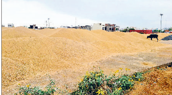
रेवाड़ी। कोसली अनाजमंडी में खुले में पड़ा हुआ गेहूं।

20600 कट्टों यानि 10300 क्विंटल का उठान ही हो पाया है। खरीद एवं उठान के अतिरिक्त मंडी में हुई आवक का गेहूं खुले में पड़ा हुआ है। हालांकि आदतियों ने कुछ गेहूं के ढेरों पर तिरपाल की व्यवस्था की हुई है, लेकिन मार्केट कमिटी कार्यालय के सामने के प्लेटफार्म पर हजारों