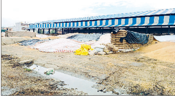
रेवाड़ी। कोसली अनाजमंडी में तिरपाल से ढका गया गेहूं।