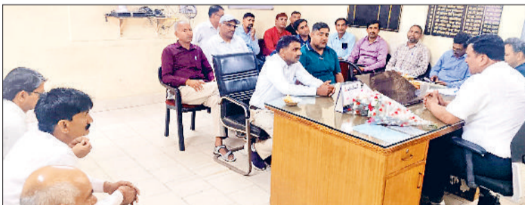
रेवाड़ी। मांगों को लेकर डीईईओ से चर्चा करते शिक्षक।