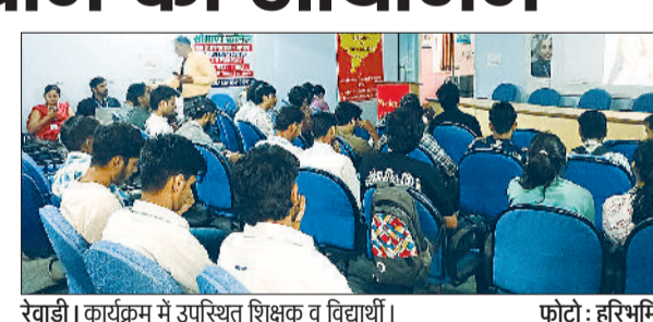
रेवाड़ी। कार्यक्रम में उपस्थित शिक्षक व विद्यार्थी।