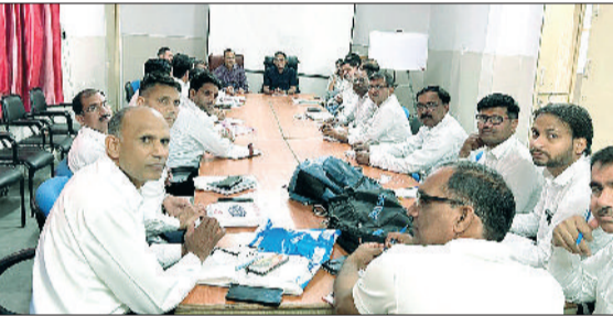
रेवाड़ी। सुपरवाइजरों को जानकारी देते हुए डॉक्टर।

केवल सेबी से पंजीकृत कंपनियों-एजेंट्स के माध्यम से ही निवेश करें। अनजान एप, लिंक या वेबसाइट के जरिए सिप में निवेश न करें। सोशल मीडिया या व्हाट्सएप-टेलीग्राम ग्रुप के जरिए दिए गए निवेश ऑफर पर भरोसा न करें। गारंटीड रिटर्न या बहुत ज्यादा मुनाफे के दावे से सतर्क रहें। निवेश करने से पहले कंपनी की वैधता व रजिस्ट्रेशन की जांच अवश्य करें। अपनी बैंक डिटेल्स, ओटीपी, पिन या पासवर्ड किसी से साझा न करें।